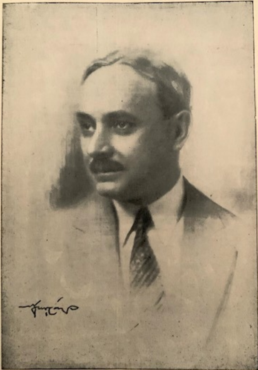
Ο ΥΠΟΥΡΓΟΣ ΤΗΣ ΚΡΑΤΙΚΗΣ ΥΓΙΕΙΝΗΣ ΚΑΙ ΑΝΤΙΛΗΨΕΩΣ Κ. Α. ΚΟΡΙΖΗΣ