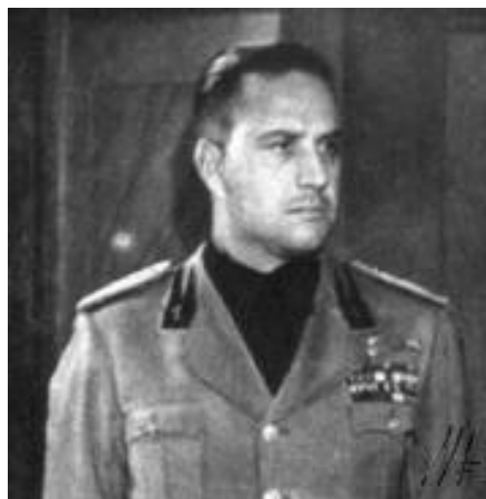
Ο κόμης Τσιάνο

ΣΤΙΣ 22 ΟΚΤΩΒΡΙΟΥ 1940 ο υπουργός των εξωτερικών της Ιταλίας κόμης Τσιάνο, έγραφε στο ημερολόγιο του: