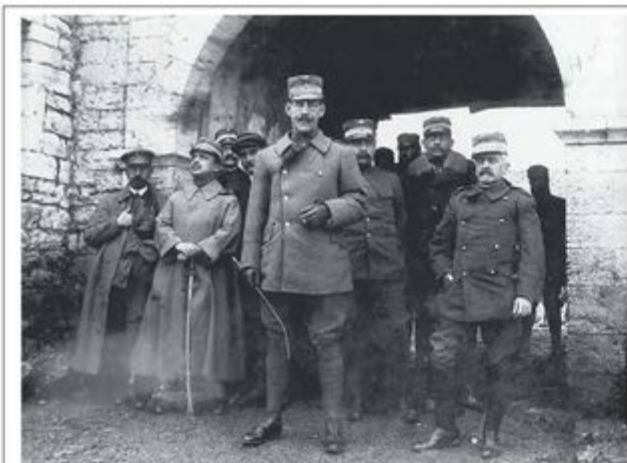
Χάνι Εμίν Αγά. Ο αρχιστράτηγος Κωνσταντίνος με επιτελείς στη κεντρική είσοδο. Διακρίνονται από αριστερά οι: Π. Καραπάνος διευθυντής επί των αυτοκινήτων του επιτελείου και οδηγός του διαδόχου, Λοχαγός Ι. Μεταξάς, διάδοχος Κωνσταντίνος, αντισυνταγματάρχης Β. Δούσμανης, λοχαγός Παπακωνσταντίνος και ο υποστράτηγος Π. Δαγκλής.