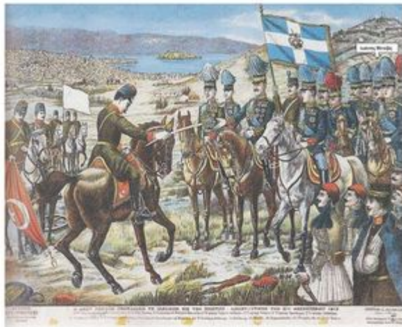
Εκς. 87 Ο ΕΞΑΤ ΒΑΣΙΛΕΥΣ ΠΑΡΑΜΕΙΝ ΤΑ ΒΙΑΣΙΝΑ ΕΙΣ ΤΟΝ ΝΙΚΗΤΗΝ ΚΩΝΣΤΑΝΤΙΝΟΝ ΤΗΝ 21ην ΦΕΒΡΟΥΑΡΙΟΥ 1913. 1) Ο Δουκισσαγιός σερβιστός Κωνσταντίνος, 2) Ο Εξάτ Βασίλευς, 3) Ο Δουκισσός και Μαζιζιόν Βιλέτς, 4) Ο πρίγκιπ Γκαίριος (Αυστρίας), 5) Ο πρίγκιπ Αντόνιος, 6) Ο πρίγκιπ Χριστόφορος, 7) Ο πρίγκιπ Αλεξάνδρος, 8) Ο πρίγκιπ Σερβός, 9) Ο Μίρτσες Μοχτιτσόβιτς (ο ενταξίος της αυτοκρατορίας του Μαζιζιόν), 10) Ο επιτελείου Δούσμανης, 11) Καλλίνος, 12) Μεταξάς, 13) Πάροχος τούρκος, 14) Ο αρχηγός των Αγίων Ιωαννίνων. Επίσημος / Στοι. Χρονόμ. / Ομάς Σερβιστός, Σκότ Βίλκιν / Αθήνα / Αθήνα, Τ. Νο22 Σούβ. / Αύστ 29 - Αθήνα / Πύλον-τροπή αλάτ 6 μέρη / Ομάς Σερβιστός, από τον Νότον. Καλλιγράφος: Σ. Χρονόμ. Έγχρωμη λιθογραφία, σε σκόλο γραμμάτ. Ίσως. 45x64,5 εκ. / 49,5x68,5 εκ. / Σελήνη ΗΕΒΕ, αρ. 495/79.

ΕΠΙΤΟΚΗ ΚΑΙ ΕΡΕΥΝΗΤΙΚΗ ΕΠΙΤΡΟΠΗ ΤΗΣ ΕΛΛΑΔΟΣ ΒΑΛΚΑΝΙΚΟΙ ΠΟΛΕΜΟΙ 1912 - 1913 ΕΛΛΗΝΙΚΗ ΛΑΪΚΗ ΕΚΚΟΤΡΟΦΙΑ ΤΟΜΟΣ Α' ΕΛΛΗΝΟΤΟΥΡΚΙΚΟΙ ΠΟΛΕΜΟΙ