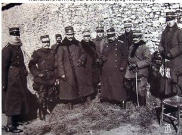
Χάνι Εμίν Αγά. Από αριστερά: πρίγκιπας Αλέξανδρος, υποστράτηγος Δαγκλής, άγνωστος, αρχιστράτηγος Κωνσταντίνος, υποστράτηγος Αλ. Σούτζος, πρίγκιπας Χριστόφορος, αντισυνταγματάρχης Β. Δούσμανης, πρίγκιπας Ανδρέας, λοχαγός Ι. Μεταξάς και πρίγκιπας Γεώργιος.