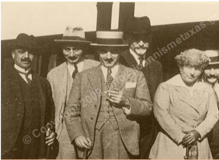
Ι.Μεταξάς, Δ.Γούναρης, Ι.Δραγούμης

Ο Ιωάννης Μεταξάς, μαζί με τον Ιώνα Δραγούμη, τον Δημήτριο Γούναρη, τον Βίκτωρα Δούσμανη τον Γεώργιο Πεσμαζόγλου, τον Ιωάννη Σαγιά αρχηγό των Επιστράτων, τον Εσλιν, τον Γ. Μερκούρη και πολλούς άλλους επιβιβάστηκαν ως διωκόμενοι από τους Γάλλους την 7/20 Ιουνίου 1917 στο πλοίο «Βασιλεύς Κωνσταντίνος», που είχε στο μεταξú αγοραστεί από τους Γάλλους δια να χρησιμοποιηθή ως μεταγωγικό, προς άγνωστη κατεύθυνση. Μέσω Μάλτας, Μάρσα, Σιρόκο, Σίντι Αμπ Αλλάχ, Τύνιδος και Μπιζέρτας, έφθασαν στις 16/29 στο Αιάκειο Κορσικής