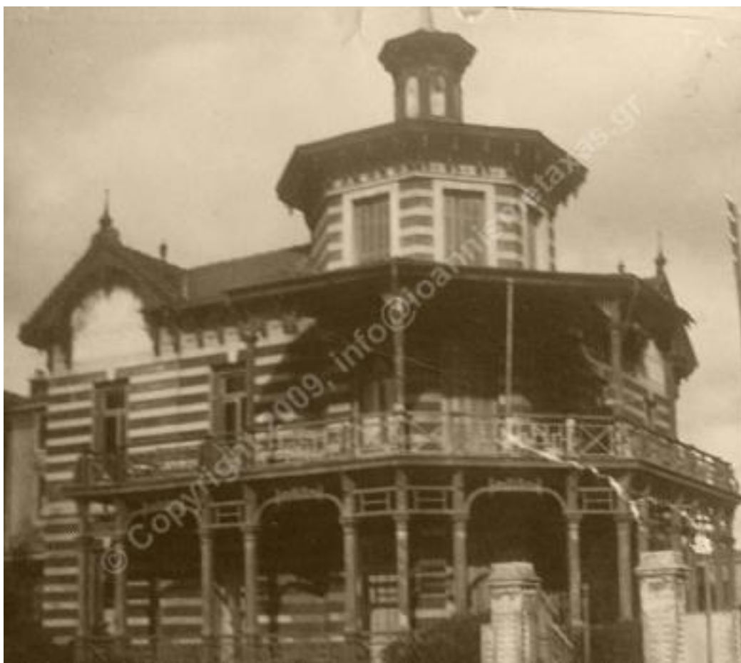
Οικία Μεταξά, Ν.Φάληρο 1921

Η απόφαση και η απάντηση που έδωσε τον Μάρτιο του 1921 δεν είναι μόνο το αποτέλεσμα των συζητήσεων και η απόφαση εκείνων των δύο συναντήσεων. Στο Ημερολόγιο του παρατηρούμε ότι από την αρχή του μήνα περιμένει αυτή την πρόκληση και είναι έτοιμος να απαντήσει. Δηλώνει πάντου εκ των προτέρων την αποφασή του απερίφραστα όπου δημιουργείται η σχετική προτροπή ή συζήτηση περί της αναμείξεως του στην Μικρασιατική Εκστρατεία. Πρόκειται επομένως για μία ώριμη απάντηση από καιρό αυτό που ανακοινώνει στις 29 και όχι κάτι που προέκυψε εκείνη την ημέρα ή μετά από τις σχετικές προτάσεις, πιέσεις ως και απειλές τις οποίες του απεύθυναν ως εξουσία οι Δημήτριος Γούναρης, Ν. Θεοτόκης και Πέτρος Πρωτοπαπαδάκης. Αξίζει όμως να δούμε τα γεγονότα από την αρχή του Μαρτίου κάθε μέρα.