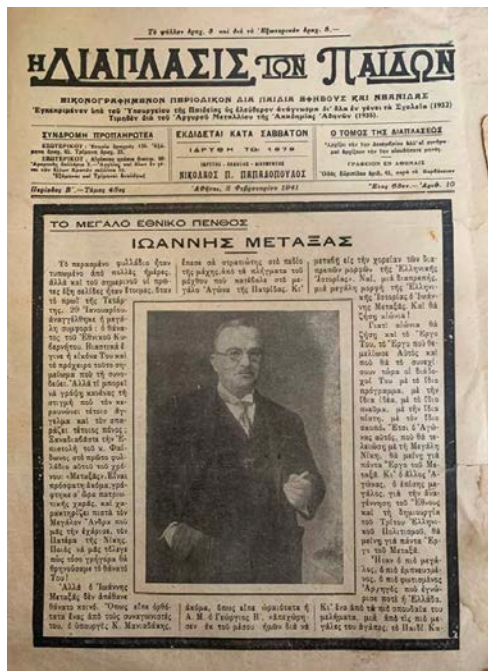
Η ΔΙΑΠΛΑΣΙΣ ΤΩΝ ΠΑΙΔΩΝ 8 ΦΕΒ 1941

Ντυμένος με πολιτική ενδυμασία, με το σήμα της Ε.Ο.Ν στο πέτο του και με γυμνό το ξίφος του Στρατηγού, όπως είχε ο ίδιος εκφράσει παλαιότερα την επιθυμία του, τοποθετήθηκε νεκρός, μαζί με ένα εικόνημα της Μεγαλόχαρης της Τήνου, ο Εθνικός Κυβερνήτης Ιωάννης Μεταξάς. Με ένα κλωνί ανθισμένης αμυγδαλιάς να τον συντροφεύει πάνω στο φέρετρο, το οποίο μετέφεραν μέλη της Ε.Ο.Ν, και την αγάπη όλου του κόσμου να συνοδεύει ή γονατιστή να παραστέκει στην νεκρική πομπή, από την Κηφισιά, έφθασε η σωρός του στη Μητρόπολη της Αθήνας.